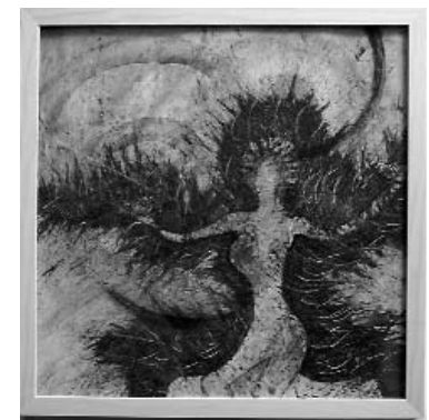
Spirale 6 - Die Schale Petra Hüller