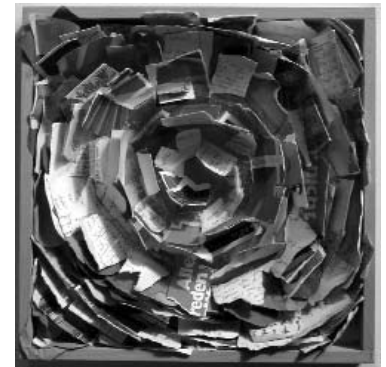
Spirale 26 - FreundInnen Petra Hüller